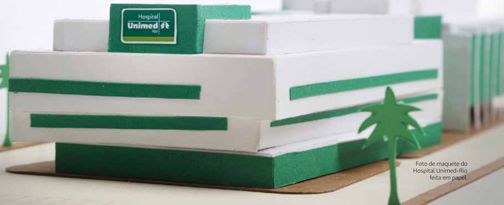
Foto de maquete do Hospital Unimed-Rio feita em papel.